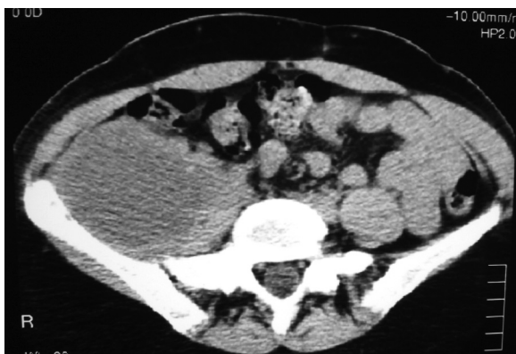
Εικόνα 1: Παρουσία υπόπυκνης, καλά αφοριζόμενης βλάβης στο δεξιό ψοίτη μυ (πριν την παρακέντηση).