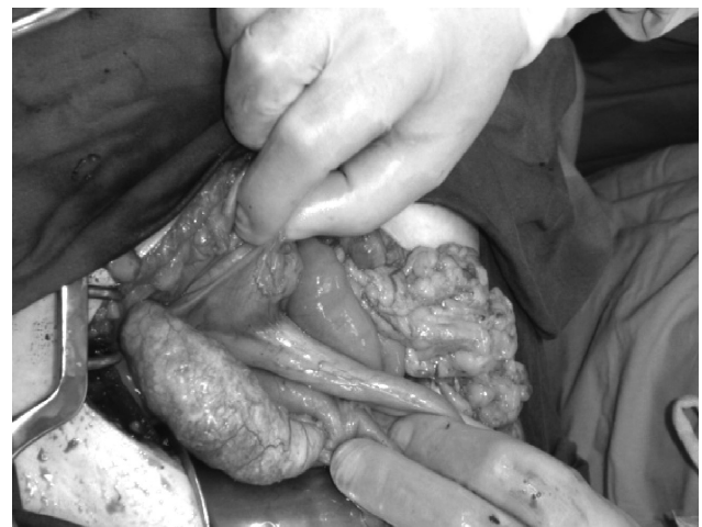
Εικόνα 2: Διεγχειρητικό εύρημα βλεννοκήλης της σκωληκοειδούς απόφυσης. (Βέλος: σκωληκοειδής απόφυση με βλεννοκήλη).

Ακριβής προεγχειρητική διάγνωση της βλεννοκήλης είναι εξαιρετικά δύσκολο να γίνει. Συνήθως